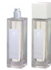
Musk ムスク ETZ-10-001