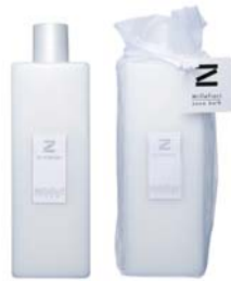
Musk ムスク BSZ-50-001

お好みにより適量を手首・首すじ・ひじ・ひざ裏などにご使用ください。 ※目の周囲、粘膜などの部分には使用しないでください。