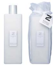
Spa&Massage Thai スパ&マッサージ タイ BSZ-50-005