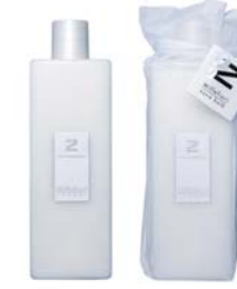
Rose ローズ BCZ-50-006