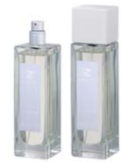
Spa&Massage Thai スパ&マッサージ タイ ETZ-10-005