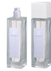
Spicy Wood スパイシーウッド ETZ-10-003