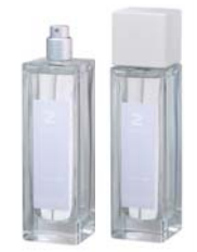
Rose ローズ ETZ-10-006