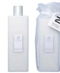
Spa&Massage Thai スパ&マッサージ タイ BCZ-50-005