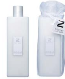
Spicy Wood スパイシーウッド BCZ-50-003