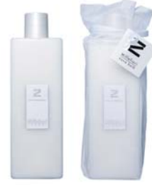
Rose ローズ BSZ-50-006