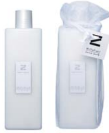
Spicy Wood スパイシーウッド BSZ-50-003