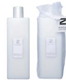
Musk ムスク BCZ-50-001