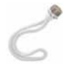
バーナーS(交換用) WICK-S-001 1,680yen(税込)