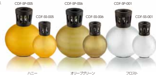
ハニー CDF-SP-005 オリーブグリーン CDF-SP-006 フロスト CDF-SP-001

アロマランプ：スフィア/スモール 4,200yen(税込) 製品サイズ:φ80x110H 材質:フロストガラス 本体付属品: バーナー/S ランプシェード 密封キャップ じょうご 説明書