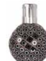
ミラー&ブラック CDF-M-014 φ122x163H