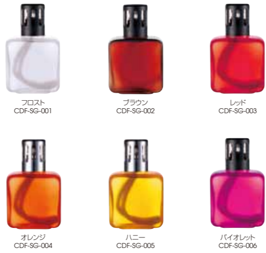
フロスト CDF-SG-001 ブラウン CDF-SG-002 レッド CDF-SG-003 オレンジ CDF-SG-004 ハニー CDF-SG-005 バイオレット CDF-SG-006

アロマランプ：スクエア 5,250yen(税込) 製品サイズ:78Wx60Dx135H 材質:フロストガラス 本体付属品: バーナー ランプシェード 密封キャップ じょうご 説明書