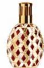
ゴールド&スカーレット CDF-M-011 102Wx68Dx174H