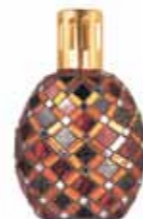
ブロンズ&ダークレッド CDF-M-016 102Wx68Dx174H