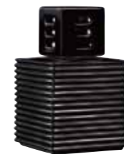
ブラック CDF-ST-002 Φ122x163H