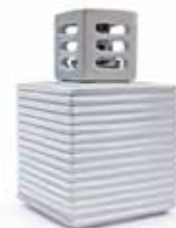
ホワイト CDF-ST-001 Φ122x163H