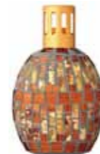
ブロンズ&ゴールド CDF-M-003 102Wx68Dx174H