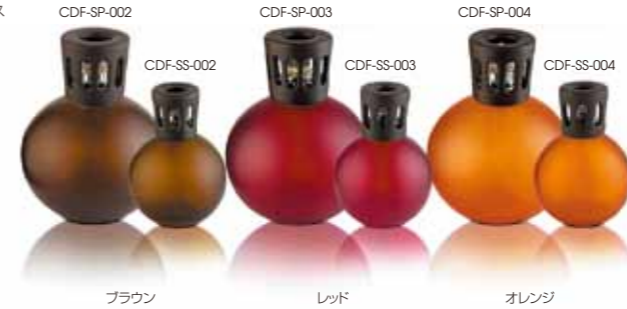
ブラウン CDF-SP-002 レッド CDF-SP-003 オレンジ CDF-SP-004

7,350yen(税込) 製品サイズ:φ115x150H 材質:フロストガラス 本体付属品: バーナー/L ランプシェード 密封キャップ じょうご 説明書