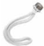
バーナーL(交換用) WICK-L-001 1,890yen(税込)