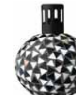
ブラック&ホワイト CDF-M-004 φ122x163H