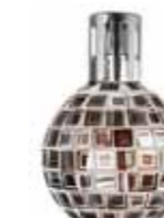
ブロンズ&ホワイト CDF-M-015 φ122x163H