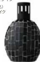
ブラック CDF-M-001 102Wx68Dx174H

アロマランプ：モザイク 8,400yen(税込) 材質:ガラス・砂・モザイク 本体付属品: バーナール ランプシェード 密封キャップ じょうご 説明書