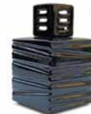
ブラック CDF-TR-002 Φ122x163H