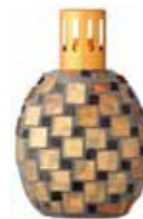
ブラウン CDF-M-008 102Wx68Dx174H