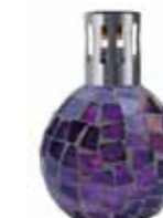
バイオレット CDF-M-013 φ122x163H