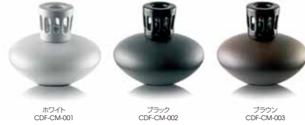
ホワイト CDF-CM-001 ブラック CDF-CM-002 ブラウン CDF-CM-003

アロマランプ：セラミック 5,250yen(税込) 製品サイズ:φ145x115H 材質:セラミック 本体付属品: バーナー/L ランプシェード 密封キャップ じょうご 説明書