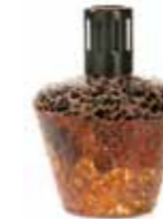
クラックブラウン CDF-M-009 φ110x154H