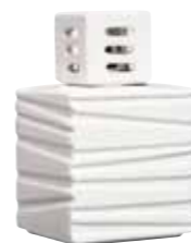
ホワイト CDF-TR-001 Φ122x163H