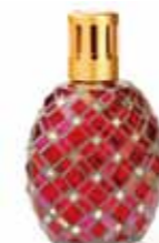
スカーレット CDF-M-010 102Wx68Dx174H