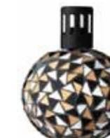
ブラック&ゴールド CDF-M-002 φ122x163H