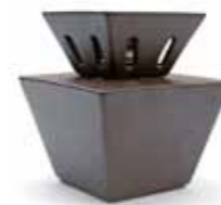
ブラウン CDF-PM-002 102Wx68Dx174H