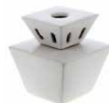
ホワイト CDF-PM-001 102Wx68Dx174H