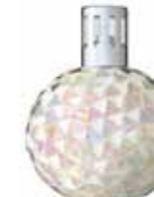
マザーパール CDF-M-007 φ122x163H