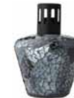
クラックブラック CDF-M-006 φ110x154H