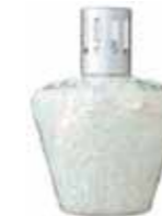
クラックホワイト CDF-M-005 φ110x154H