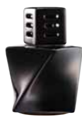
ブラック CDF-TW-002 Φ110x154H