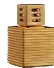
ゴールド CDF-ST-003 Φ122x163H