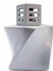
ホワイト CDF-TW-001 Φ110x154H

アロマランプ：デザイン 6,300yen(税込) 材質:セラミック 本体付属品: バーナーL ランプシェード 密封キャップ じょうご 説明書