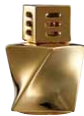
ゴールド CDF-TW-003 Φ110x154H