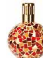
レッド&ゴールド CDF-M-012 φ122x163H