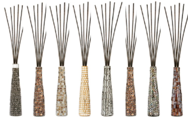
ブラック DIF-BM-001 レッド DIF-BM-002 パール DIF-BM-003 ゴールド DIF-BM-004 シルバー DIF-BM-005 ブラウン DIF-BM-006 グレー DIF-BM-007 レッド DIF-BM-008

ディフューザー：モザイク 5,250yen(税込) 製品サイズ：φ50x270H スティック黒550mm/6本入