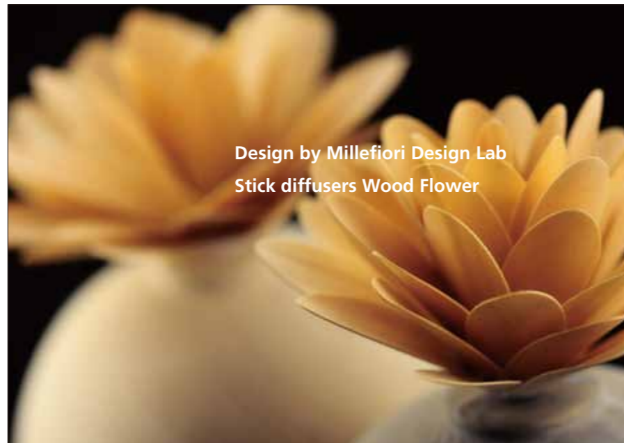
Design by Millefiori Design Lab Stick diffusers Wood Flower