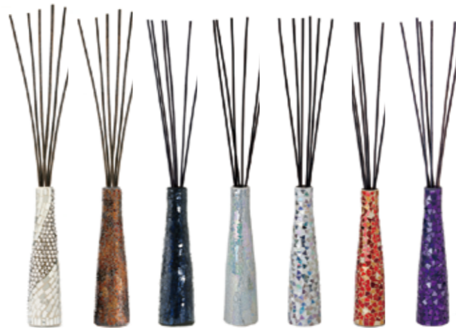
パール DIF-BM-009 レッド DIF-BM-010 ブラック DIF-BM-011 ホワイト DIF-BM-012 ホワイト DIF-BM-013 レッド DIF-BM-014 バイオレット DIF-BM-015