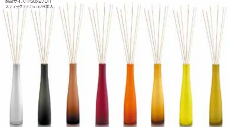
フロスト DCE-B-001 ブラック DCE-B-002 ブラウン DCE-B-003 レッド DCE-B-004 オレンジ DCE-B-005 ハニー DCE-B-006 イエロー DCE-B-007 オリーブグリーン DCE-B-008

ディフューザー：バンブー 2,625yen(税込) 製品サイズ：φ50x270H スティック550mm/6本入